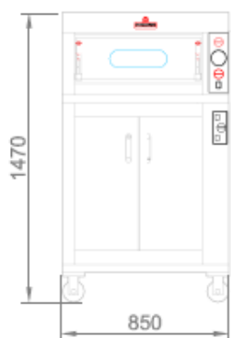
VISTA FRONTALE + CELLA DI LIEVITAZIONE FRONT VIEW + PROVER