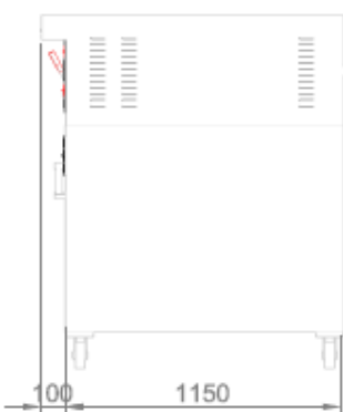
VISTA LATERALE + CELLA DI LIEVITAZIONE SIDE VIEW + PROVER